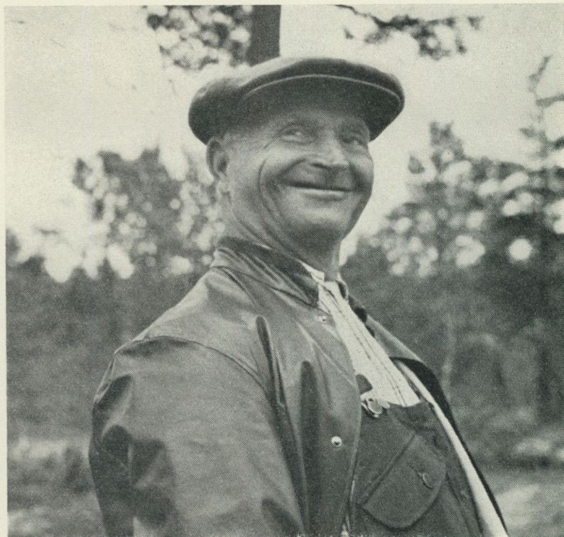
Veje-Abram kände Stalo.

Stalo var. Stalo var Stalo och ingen annan, lapparnas gamle ärkefiende, stor, stark och dum och begiven på människokött.