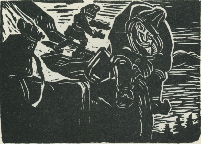
Lappojken Askovis har lurat Stalo att ställa silversäcken ifrån sig och sätta sig till vila ytterst på kanten av ett fjällstup, där en knuff kan få honom att ramla ned. Träsnitt av Emilie Demant Hatt till en lapsk saga.

och ska hjälpas åt att lyfta av den stora kokande köttgrytan, passar bruden på att från sin sida lyfta högre, så att det sjudande köttspadet hälls ut över brudgummen och rinner genom hans barmglip ner över magen och skållar "grejorna". Och när Stalos dotter som brud ligger och väntar på lappojken som brudgum, kommer denne inte med sitt naturliga organ utan sticker kniven i hennes sköte och sprättar upp hennes mage. Som makaber sadism ter sig allt detta i ett referat, i sägnen berättas det med känslolös, kall realism.