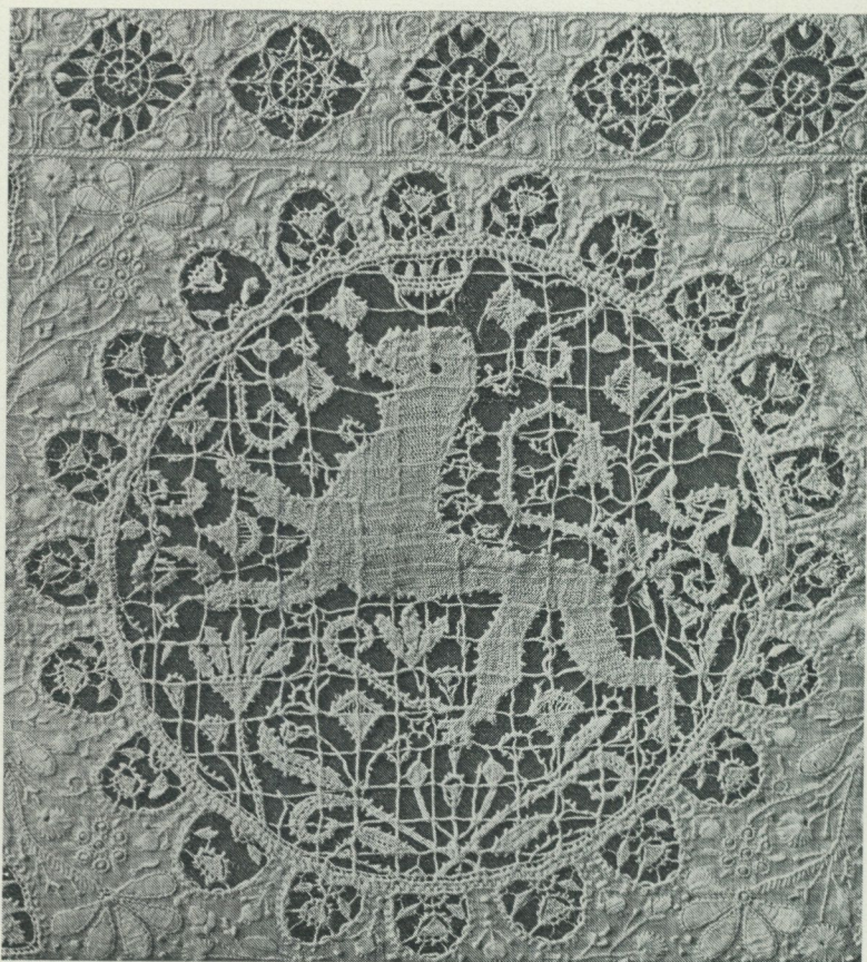
Del av broderi på örngott, daterat 1648. Det utskurna partiet med krönt lejon är utförd i punto in aria.

ner kom generöst till hjälp, och nu är det införlivat med samlingarna.