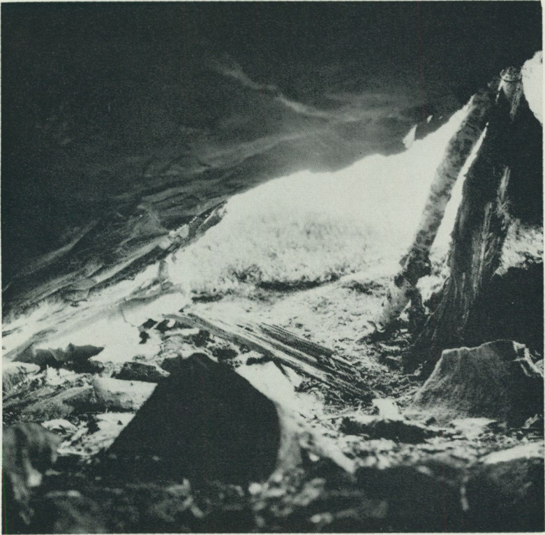
Grottöppningen sedd från eldstaden, som vid sydänden avgränsas av den spetsiga större stenen i förgrunden. Vid tagningen av denna interiörbild flyttades en 86 cm lång grov träbräda inåt från marken vid ingångens vänstra del, där den kanske varit del av en vägg eller dörr.

Efter denna översikt följer här ett par mera konkreta exempel på 1964 års fältundersökningar i svenska lappmarker.