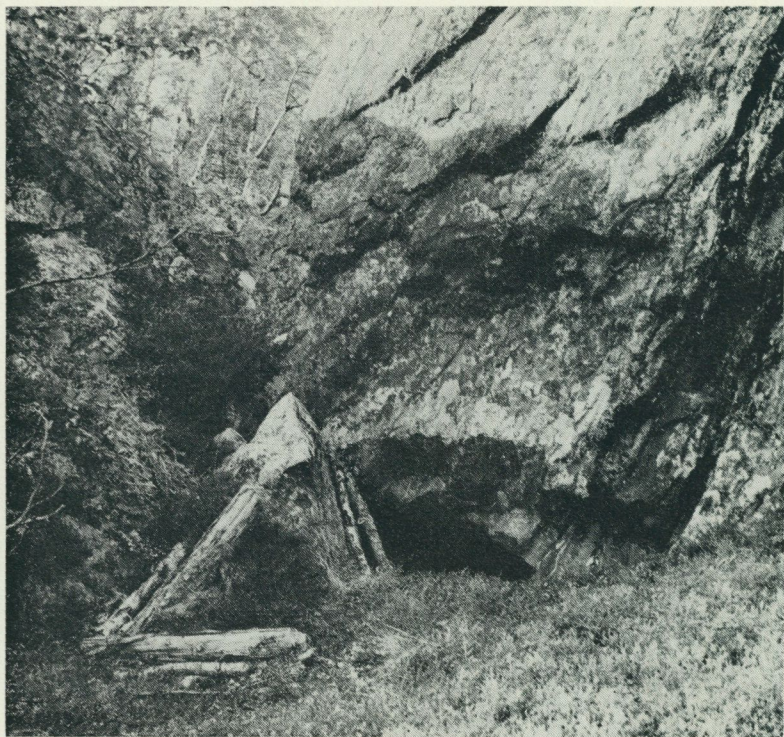
Grottan är i sydvästra hörnet ett ca 10 m långt och 5 m högt stenblock. Ingången är 55 cm hög, och utanför den på gräsvallen är några huggna stycken av björkstammar, av vilka åtminstone tre står som en slags vägg vid öppningen.

varit koncentrerade till framför allt skogsnomaderna i Udtja-tjavelk och den bofasta samebefolkningen i fjällområdet kring Tjeggelvas, i båda fallen inrymmande både etnologiska och arkeologiska arbetsuppgifter. Hösten 1963 påbörjades en etnologisk inventering av aktuella förhållanden hos nomaderna. Resultaten från dessa sex år utgöres i Lapska arkivet av omkring 350 blad anteckningar, 150 uppmättningsritningar och mer än 2.000 fotografier.