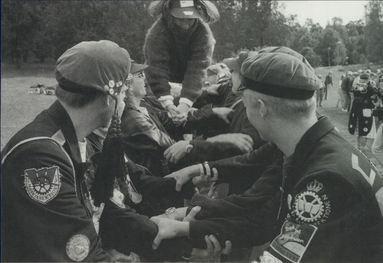
Insparkning, "phösning", vid KTH, Stockholm. Foto Peter Segemark 1993.

firandet har blivit särskilt ryktbart för att inte säga beryktat eftersom den motorburna ungdomen då samlas i tusental till exempel i Dalarna på Öland eller i Åhus. Det våldsamma firandet som därvid förekommer rapporteras regelbundet i massmedia. Skillnaden mot förr är dock snarast att festräjongen vidgats med motorcyklarna och bilarna varigenom invasionen blir mångdubbelt större än på "dansebaneländets tid" (Frykman 1988).