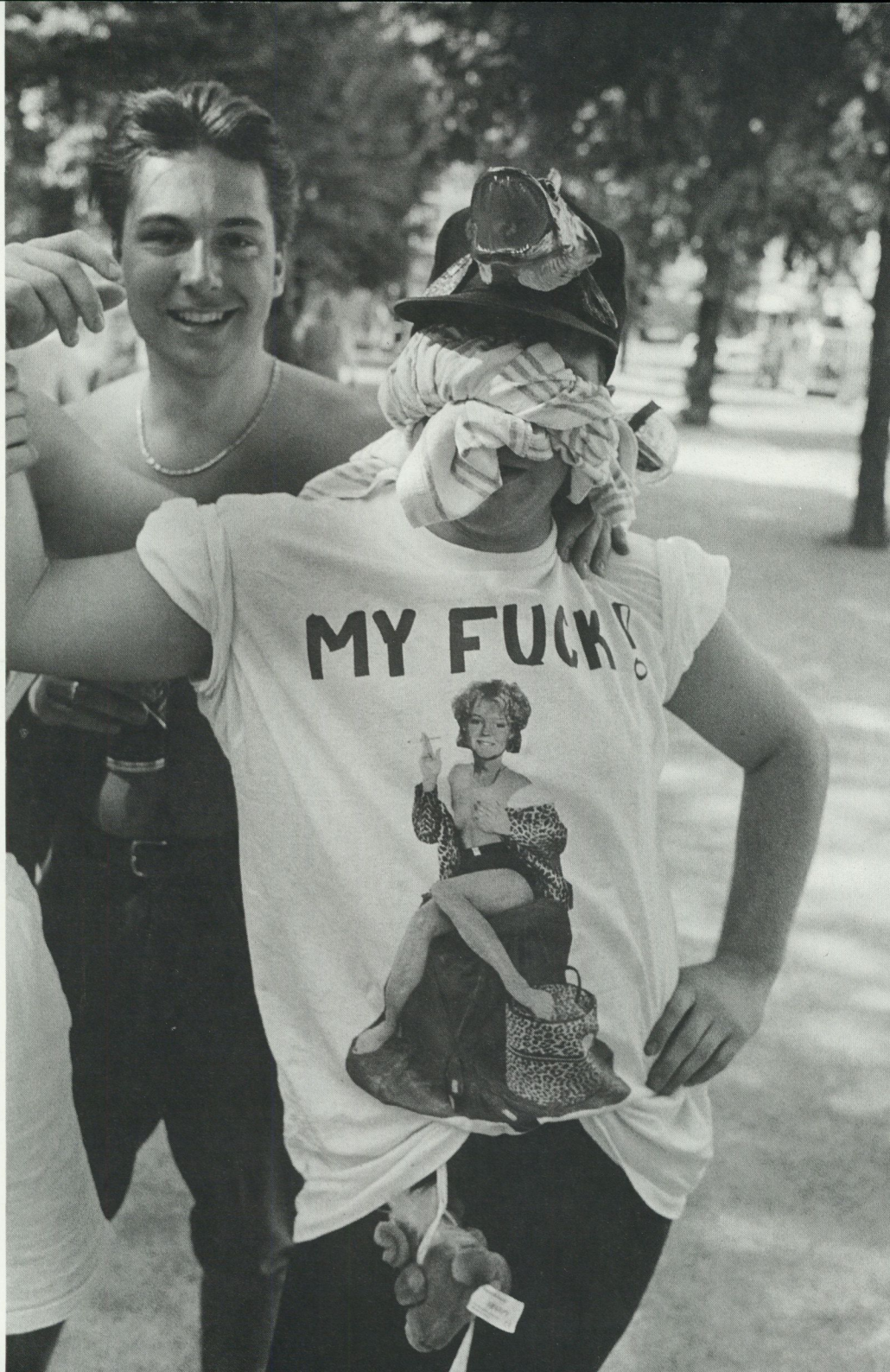
Svensesexa, Stockholm 1992.