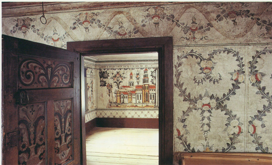
Danielsgården i Bingsjö, Dalarna med målningar av Winter Carl Hansson 1799–1801.