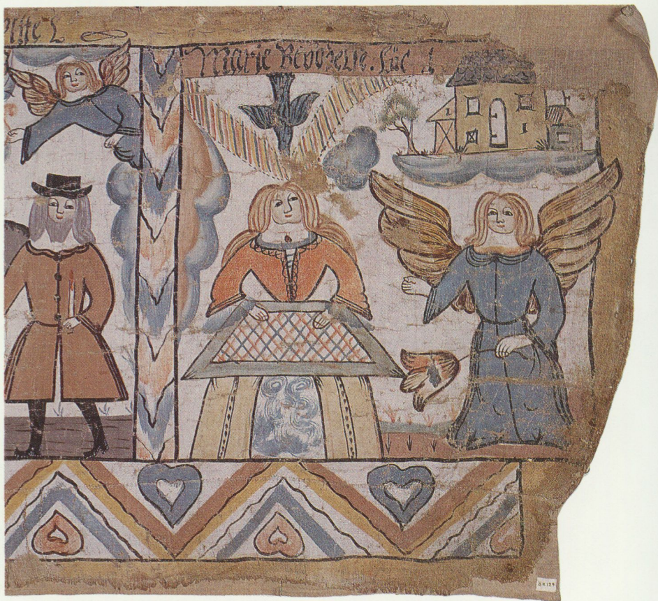
Marie bebådelse, utsnitt ur bonadsmålning av Nils Lundbergh 1765. Ägare och foto Örkelljunga hembygdsgörning.

Med upplysningstiden ändrades helgdagsbilden radikalt. År 1772 blev rentav ett märkesår genom "stora helgdöden". Det var då en lång rad helgdagar – inte minst Mariadagar – drogs in, allt för att gynna näringslivet. Ingreppet måste ha varit kännbart, men torde också ha främjat landets välbefinnande. Medan man under stormaktstiden firat kungens död med landssorg ett helt år med svarta kläden i kyrkorna och flera timmars klockringning, inskränktes sorgfirandet och ringningen nu radikalt (Bringéus 1994).