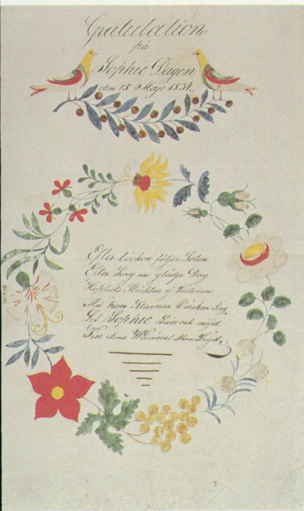
Namnsdagsgratulation från Södermanland 1834.