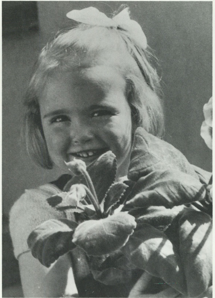
Mors dag. Foto Gösta Ask 1947. Ur Morgontidningens arkiv, Nordiska museet.

visar att det också fanns regionala variationer i det svenska festmönstret.