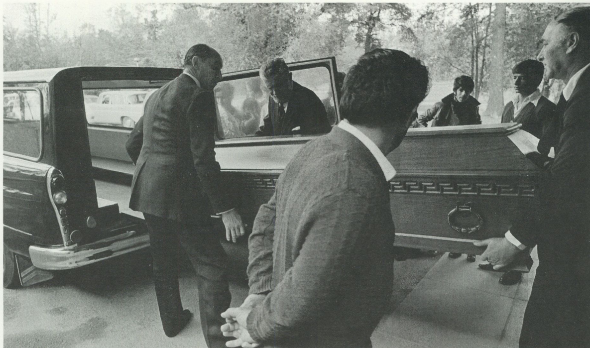
Kistan med den döde.

bara medförde allmänt duande utan också påverkade festmönstret i stort. Den obligatoriska placeringen ersattes av "fri" placering. Den stränga klädkoden både för herrar och damer försvann. Fracken bannlystes liksom den långa klänningen, till och med vid doktorsmiddagar.