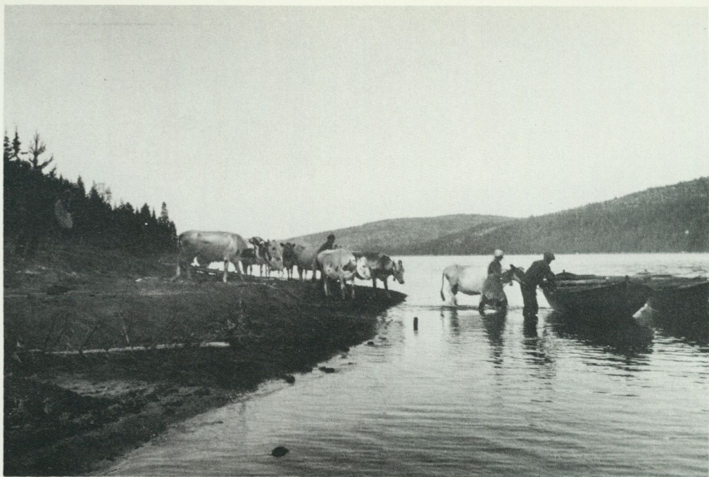
Bild från Ångermanlandskusten som visar hur det går till när korna föres över Mjältösundet i båt till sommarbetet.

'murpanna'. Detta i vanliga bondgårdar, både större och mindre."