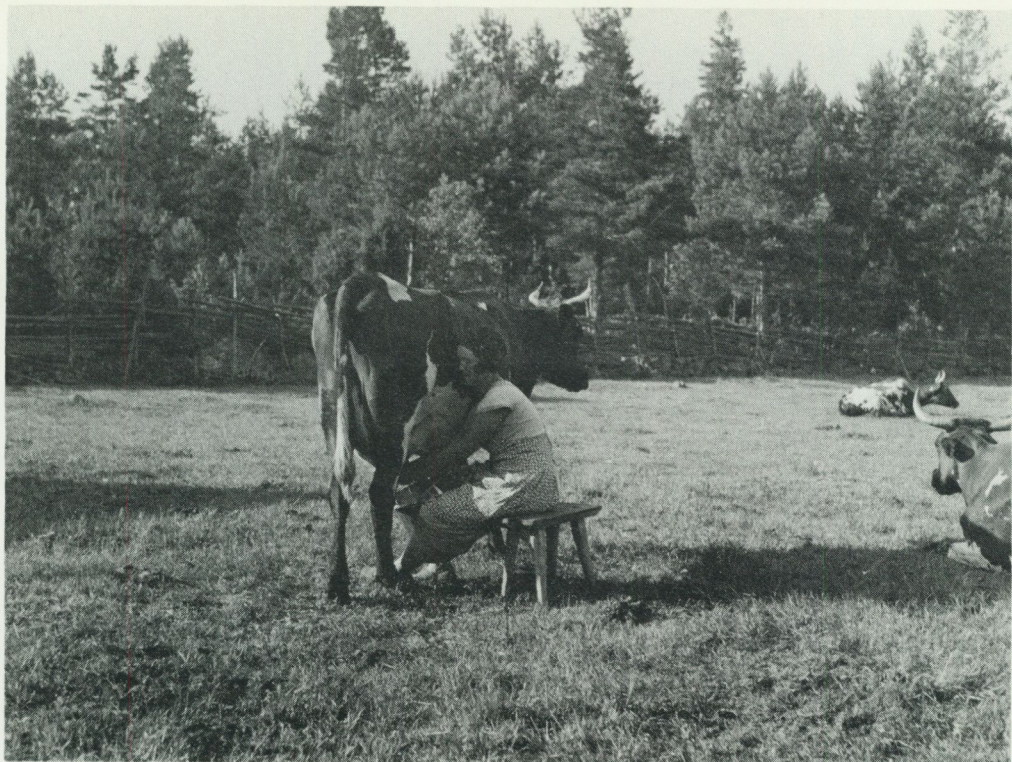
Sommartid mjölkades korna på många håll ute på betesmarken utan att man hade bindslen och ofta också utan mjölkpall som dock den här kvinnan hade. Bilden togs 1934 i Stora Sinnerstads by i Småland av R. Odencrantz.

omhus, men i Sandika Harg som jag förut nämnt var jag själv med 1916–1917. På morronen när det var svalt, var det så ljuvligt att sitta och mjölka nere vid sjökanten, korna låg och väntade på sin tur och allt gick så bra, men kvällarna var värre. Vi hade ingen pall utan satt på huk eller stod på knä bredvid den obundna kon. Kom det då bara en broms på någon av de andra korna då, så var det färdigt. Då gick hela raden bara sin väg och den man satt hos också förstås. Lite ute från land låg en ö som kallades 'Öra, dit kunde ibland hela raden marschera ut och då måste vi traska efter med ok, flaskor och allt, fast vattnet stod över skorna (---). Men när det regnade var det ruskigt att mjölka ute. Vi hade stora bleckflaskor med lock som gick bra att bära på oket, 15 liter gick det i dem. Efter