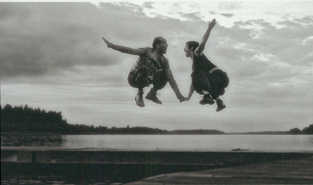
Juristen från Zürich och aktrisen från Sankt Gallen.

ten i bygden är total. Herräng Dance Camp som sommarnav för öst kontra väst, för kultur kontra natur, för fantasi kontra realitet. Herräng Dance Camp som surrealistisk spegelbild av verkligheten. Herräng efter 1982.